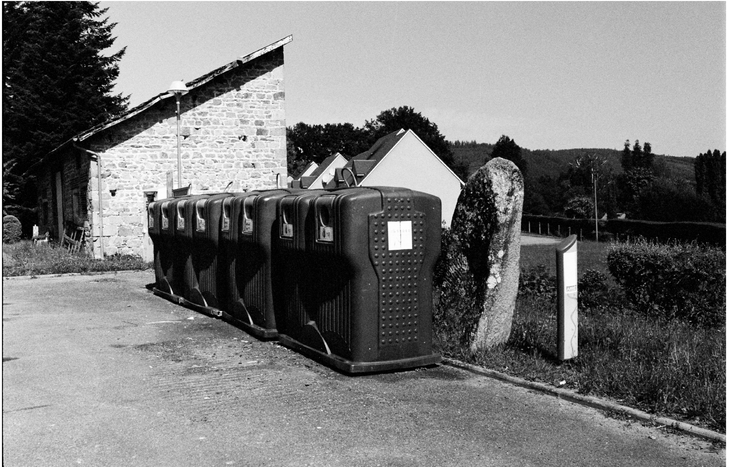
TROIS PETITS PATRIMOINE_ VASSIVIÈRE UTOPIA / NEDDE