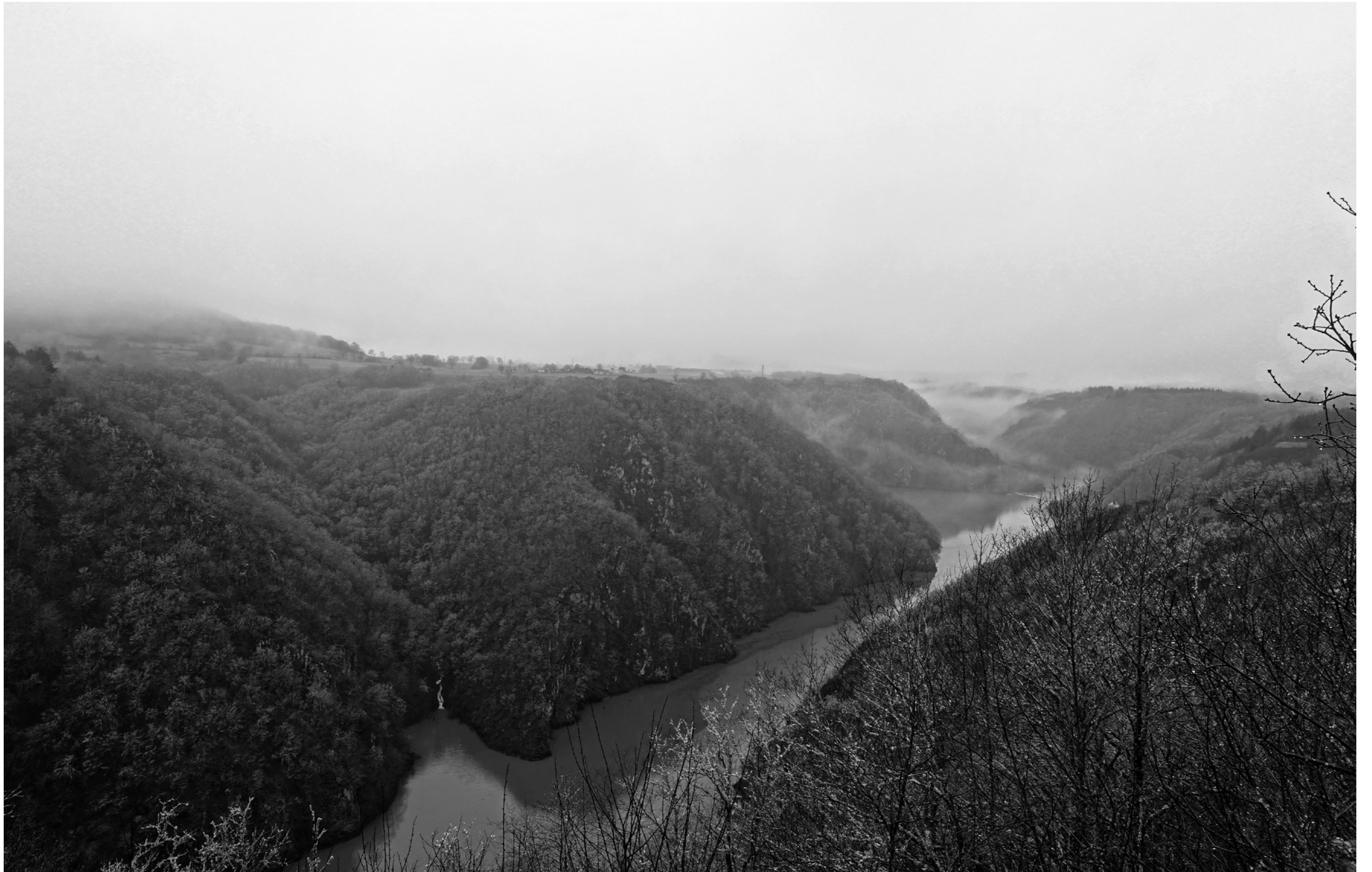
SITE DE SAINT-NAZAIRE