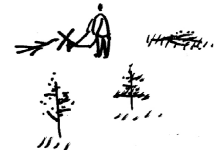
▲ Coupe des piquetages de conifères