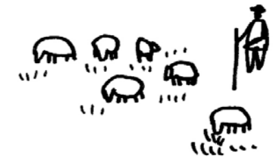
▲ Gestion agro-pastorale du fond de vallée - un agriculteur de la commune potentiellement intéressé