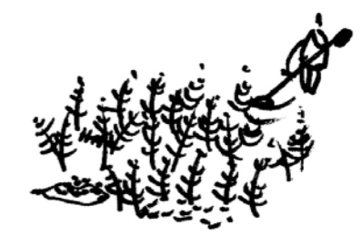
▲ Fauche des colonies de fougère-aigle pour permettre une gestion pâturée