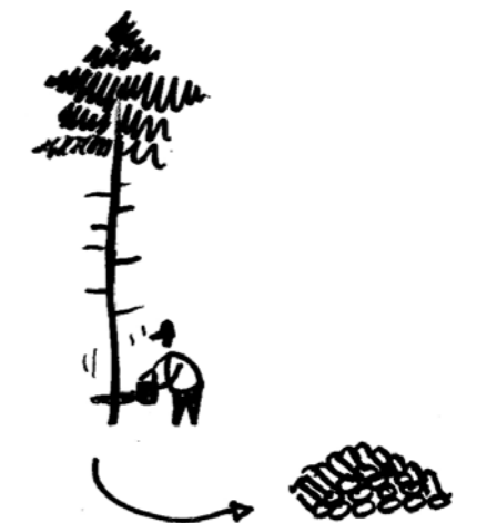
▲ Ouverture de vues, coupes et gestion du bois sur site