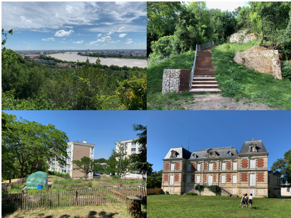
Parc de l'Ermitage, 2021, B. D. Jardins à Cenon, 2020, B. D.