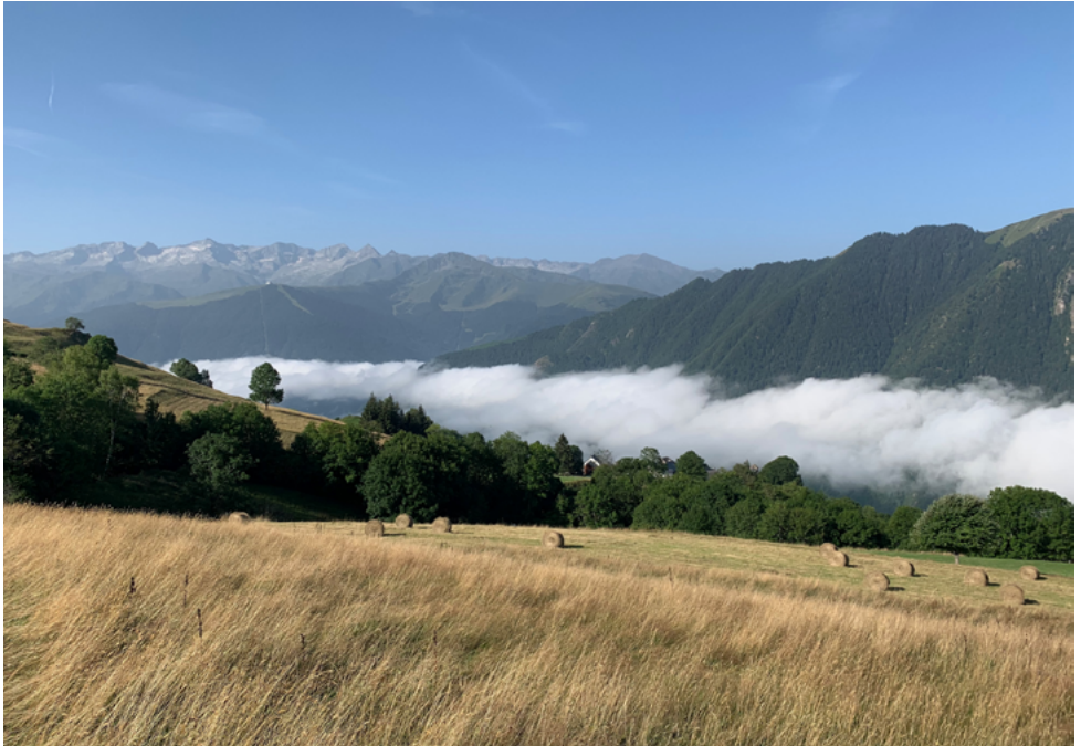
Prairies à Artigue, 2021, BD