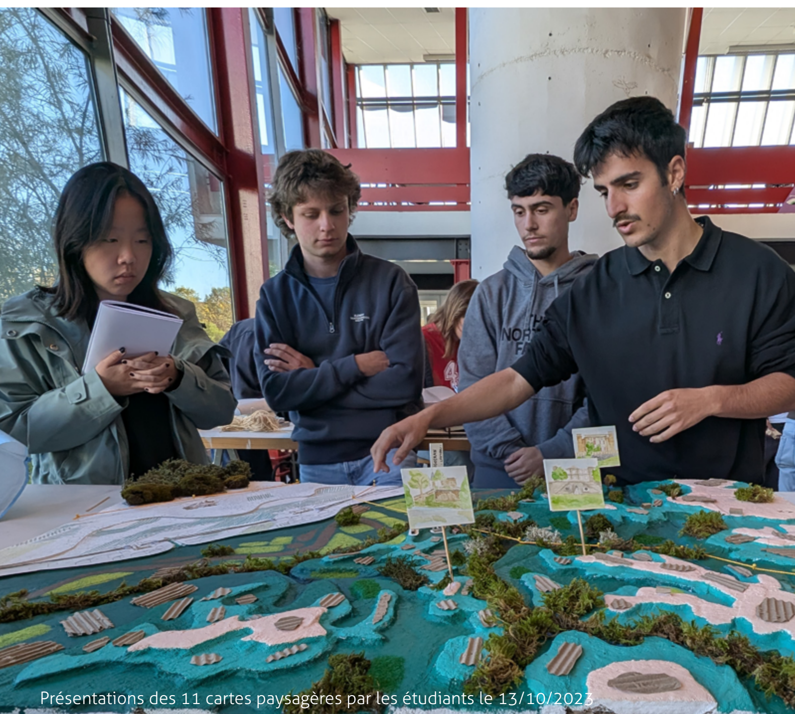
Présentations des 11 cartes paysagères par les étudiants le 13/10/2023